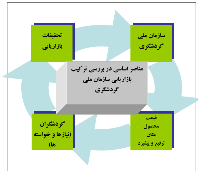
شکل ۲: عناصر اساسی در بررسی ترکیب بازاریابی سازمان ملی گردشگری مأخذ مطالب: (اسلام، ۱۳۸۲: ۲۷۵) تهیه شکل: پژوهشگران

مهمترین هدف بازاریابی گردشگری داخلی جلب هر چه بیشتر دیدارکنندگان از منطقه‌ای خاص است. به همین دلیل باید تصویر روشنی از امکانات، جاذبه‌ها و چگونگی دسترسی به آنها را فراهم آورد.