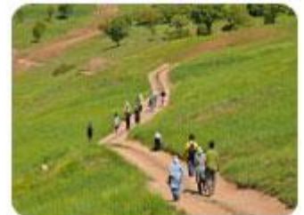
تور پالنگان - کردستان

خدمات : ۲ شب اقامت در خانه روستایی تجهیز شده، وسیله نقلیه توربستی، حمل بار توسط قاطر، اقامت به همراه صبحانه و دو وعده ناهار، دو وعده شام،