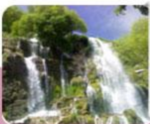
گشت و گذار