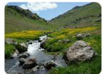
تور نئور - سوباتان

خدمات : ۱ شب اقامت در هتل ۵ ستاره اسپیناس، ۲ شب اقامت در کلبه های چوبی با تمام امکانات رفاهی، وعده های غذایی شامل ۴ وعده صبحانه، ۲ وعده شام