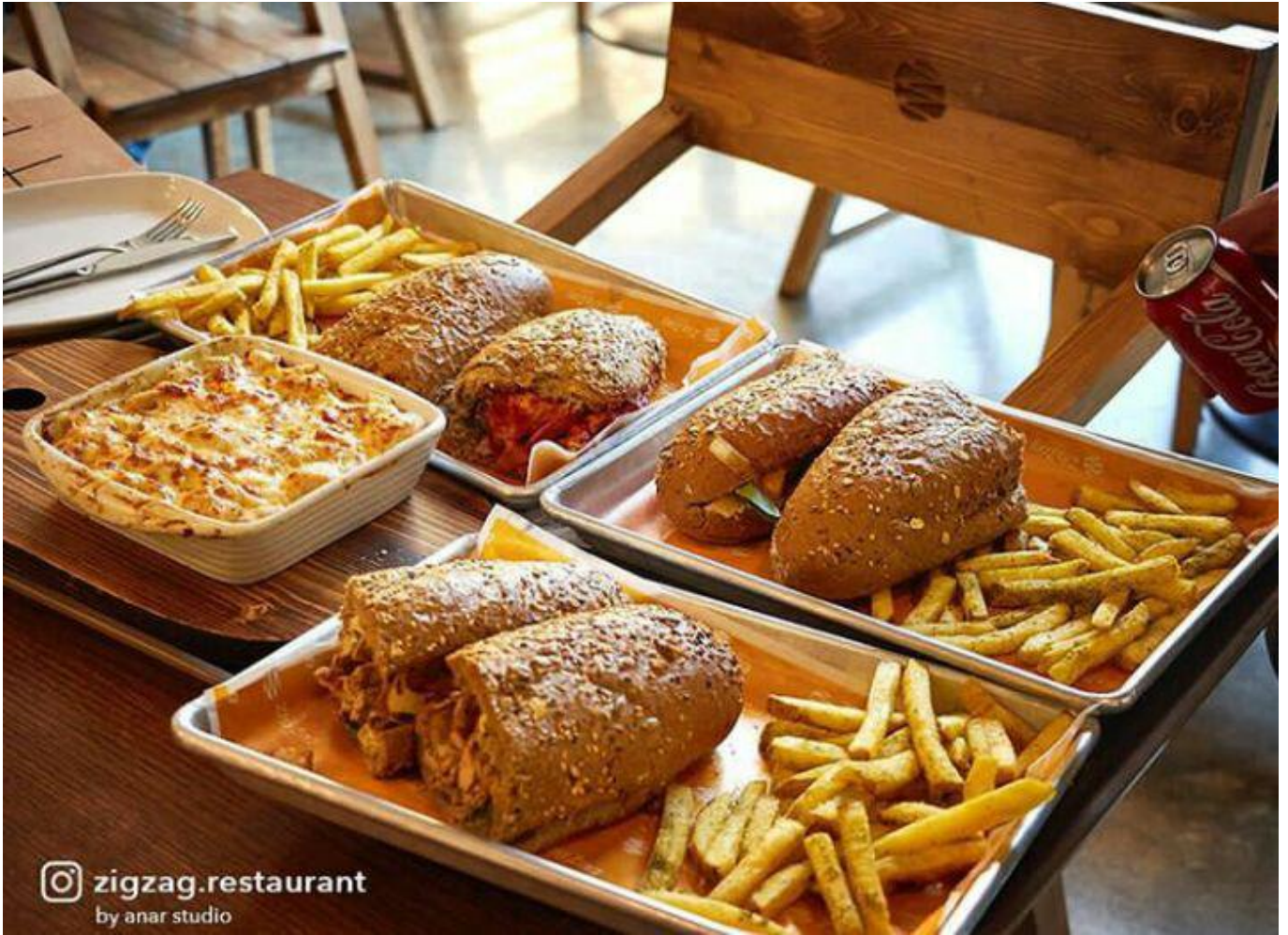
zigzag.restaurant by anar studio